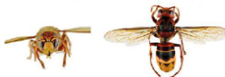
Frelon d'Europe, Vespa crabro

Le frelon d'Europe , Vespa crabro , a l'abdomen à dominante jaune clair, avec des bandes noires. Sa tête est jaune de face et rouge au dessus. Son thorax et ses pattes sont noirs et brun-rouges. Les ouvrières mesurent entre 18 et 23mm et les reines entre 25 et 35.