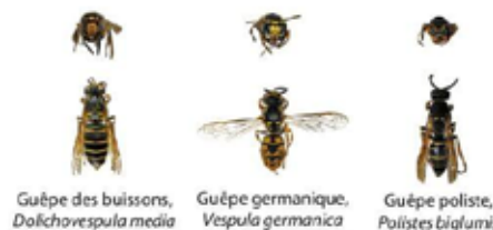
Guêpe des buissons, Dolchovespula media

Les guêpes sont plus petites que les frelons. Les ouvrières mesurent environ 15mm en fin d'été. Attention, une reine de guêpe peut dépasser légèrement 20mm, c'est-à-dire la taille du frelon asiatique représenté ici sans la tête. Au printemps les guêpes peuvent donc être plus grande que les premières ouvrières de frelon.