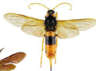
Sirex géant, Urocerus gigas

Le sirex géant est un Hyménoptère dont la larve se nourrit de bois. La femelle peut atteindre 4,5 cm, a une coloration proche du frelon asiatique, mais s'en distingue facilement par des antennes longues entièrement jaunes ainsi que par la présence d'une longue tarière lui permettant de pondre dans le bois. Cet insecte est inoffensif.