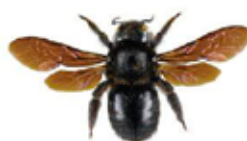
Xylocope ou abeille charpentière, Xylocopa violacea

L' abeille charpentière mesure entre 2 et 3 cm. C'est l'une des plus grandes abeilles européennes. Elle est entièrement noire avec des reflets bleu violacés. Elle construit son nid dans le bois mort et nourrit ses larves de pollen.