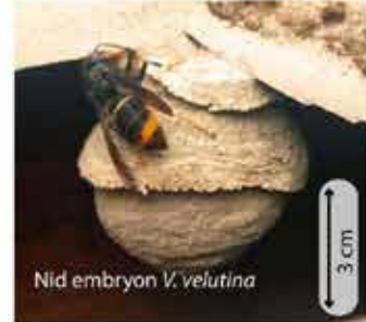
Nid embryon V. velutina

Au printemps, chaque reine fondatrice construit seule son nid dans un lieu souvent protégé. Chez la plupart des guêpes le nid embryon ressemble à une petite sphère de 5 à 10 cm de diamètre avec une ouverture vers le bas. Chez les frelons, la colonie n'hésitera pas à déménager si l'emplacement ne convient plus (manque de place, de sécurité).