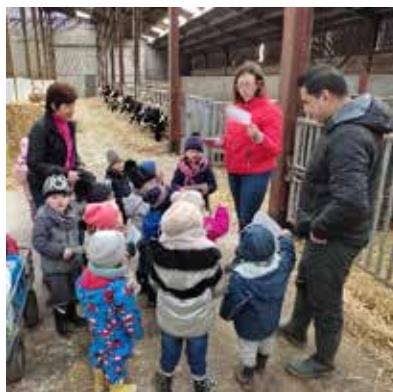
Le 28 mars, les élèves d'accueil et de 1ère maternelle ont passé la matinée à la ferme de Rosemalou à Atrin. Ils ont nourri les vaches, les moutons. Ils ont ramassé les oeufs et ils ont vu naître un pousin !