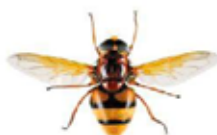
Volucelle zonée, Volucella zonaria

De nombreuses mouches (Diptères) peuvent ressembler à des guêpes ou des frelons. Mais à la différence de ceux-ci elles ne possèdent qu'une seule paire d'ailes au lieu de deux. Leurs yeux sont généralement beaucoup plus globuleux et leurs antennes plus courtes.