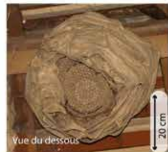
Vue du dessous