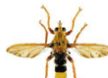
Asile frelon, Asilus crabroniformis