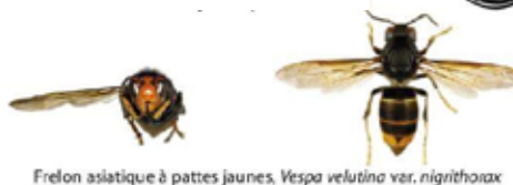
Frelon asiatique à pattes jaunes, Vespa velutina var. nigrithorax

Le frelon asiatique à pattes jaunes, Vespa velutina , est à dominante noire, avec une large bande orange sur l'abdomen et un liseré jaune sur le premier segment. Sa tête vue de face est orange, et les pattes sont jaunes aux extrémités. Il mesure entre 17 et 32mm.