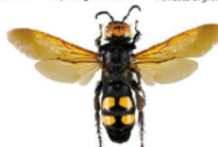
Scolie des jardins, Megascolia maculata flavifrons

La scolie des jardins fait partie des plus imposantes "guêpes" européennes. Elle est de ce fait fréquemment confondue avec le frelon asiatique. Sa pilosité est très épaisse. Son corps est noir brillant, sa tête est jaune sur le dessus et elle possède 4 zones jaunes et glabres sur l'abdomen. C'est un parasite de larves de gros Coléoptères (comme le Hanneton).